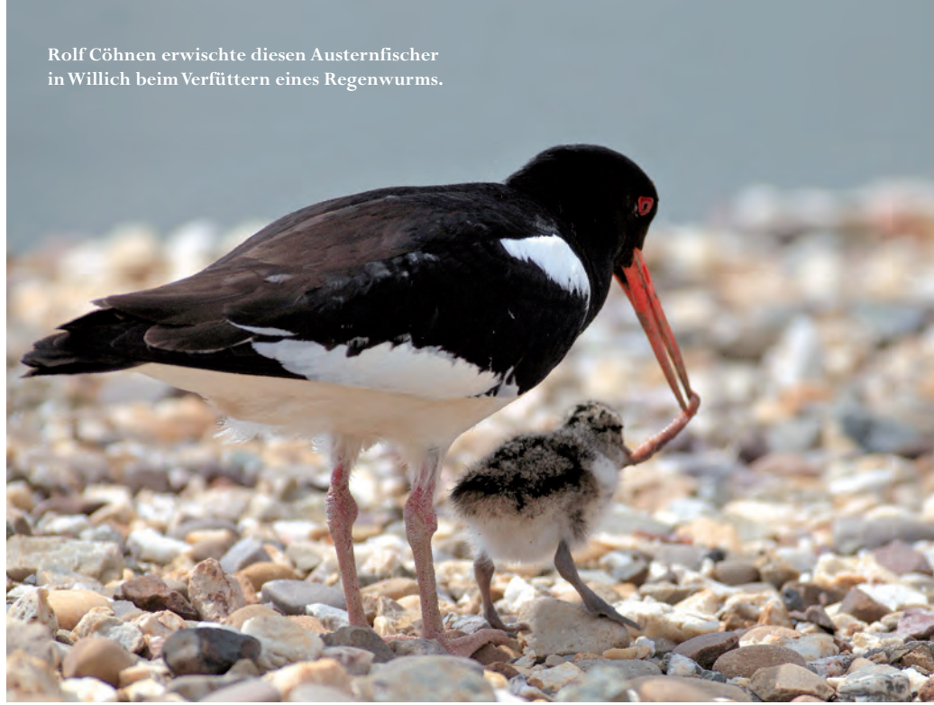
Rolf Cöhen erwischte diesen Austernfischer in Willich beim Verfüttern eines Regenwurms.