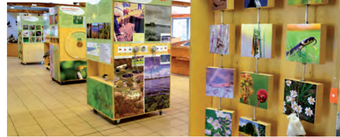
Die neue Dauerausstellung mit vielfältigen Infoelementen

Stationen im Rheinland realisiert Projekte an der Schnittstelle zwischen Kulturlandschaftspflege und Natur. Mit der Umsetzung des Aufbaus wurden unter anderem die Werkstätten des Heilpädagogischen Zentrums Krefeld - KreisViersen beauftragt, vieles erfolgte aber auch in Eigenregie mit der Unterstützung ehrenamtlicher Mitarbeiter.