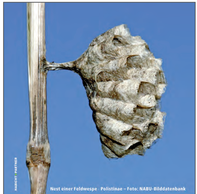
NABUICHT - PARTNER