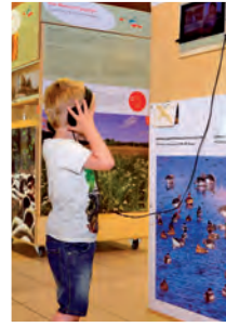
Eingebaute Displays zeigen kleine Filme zur Artenvielfalt.

Finanziert wurden Konzeption und Umsetzung vom LVR-Netzwerk Kulturlandschaft im Rahmen des Projekts „Freizeit und Lernen inklusiv gestalten – Natur für alle“. Die Kooperation des Landschaftsverbandes Rheinland mit Biologischen