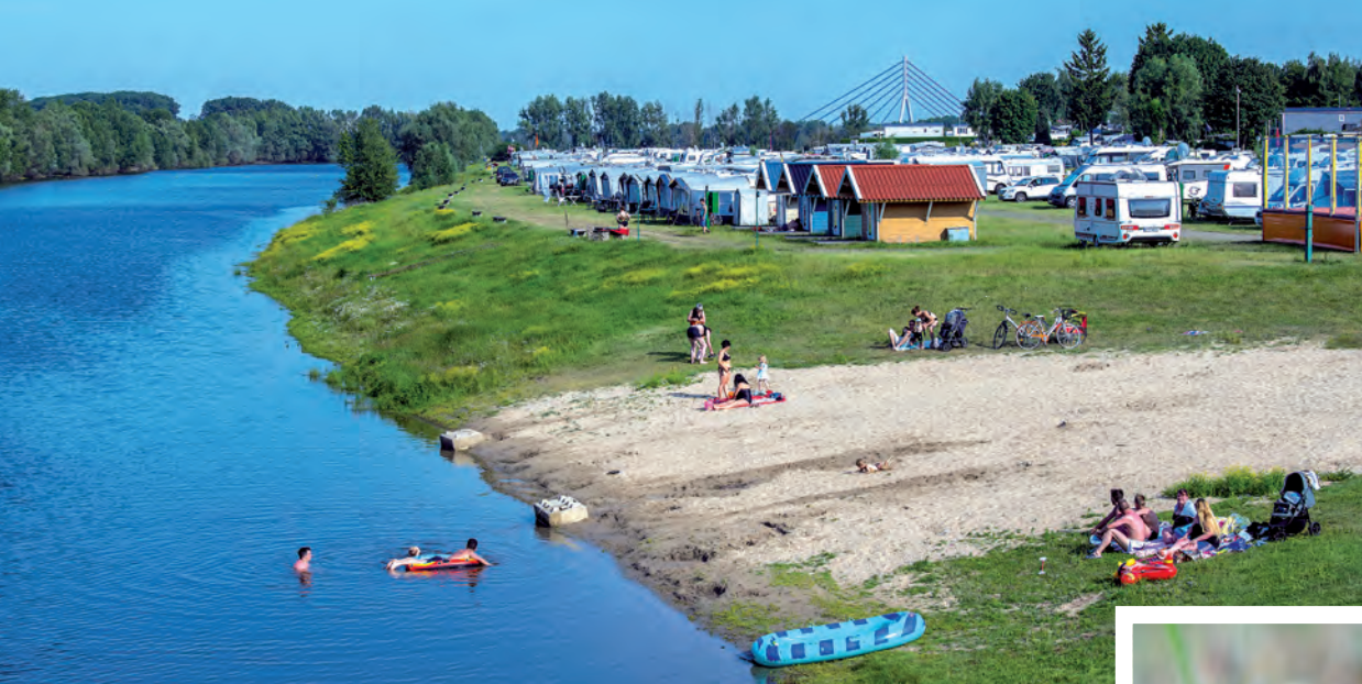
Ein Teilbereich des Campingplatzes Grav-Insel