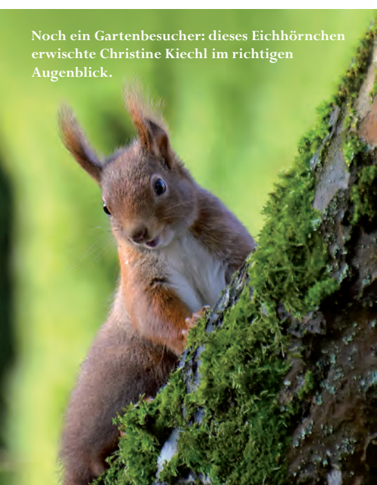
Noch ein Gartenbesucher: dieses Eichhörnchen erwischte Christine Kiechl im richtigen Augenblick.