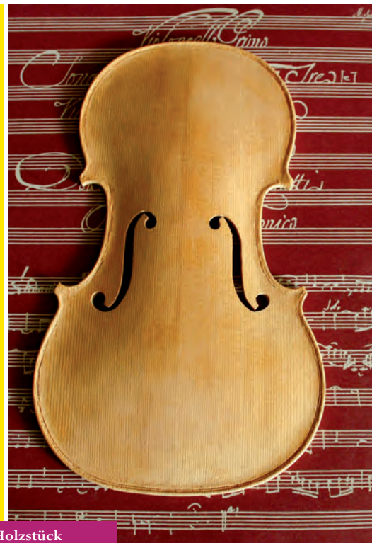
Ein Holzstück nimmt Gestalt an.

Die Natur ist im Grunde der Ursprung aller Musik. Als die Menschen vor vielen 1.000 Jahren angefangen haben zu musizieren, haben sie dafür – neben ihrer Stimme – Gegenstände aus Holz verwendet. Sie haben Klanghölzer und Flöten geschnitzt und so sind immer mehr verschiedene Instrumente entstanden. Die meisten Instrumente werden bis heute aus Holz gefertigt, z. B. Streich- und Holzblasinstrumente, aber auch Xylophone und Klaviere. Die Bauweise anderer Instrumente hat sich allerdings gewandelt: so sind Querflöten inzwischen meistens aus Metall.