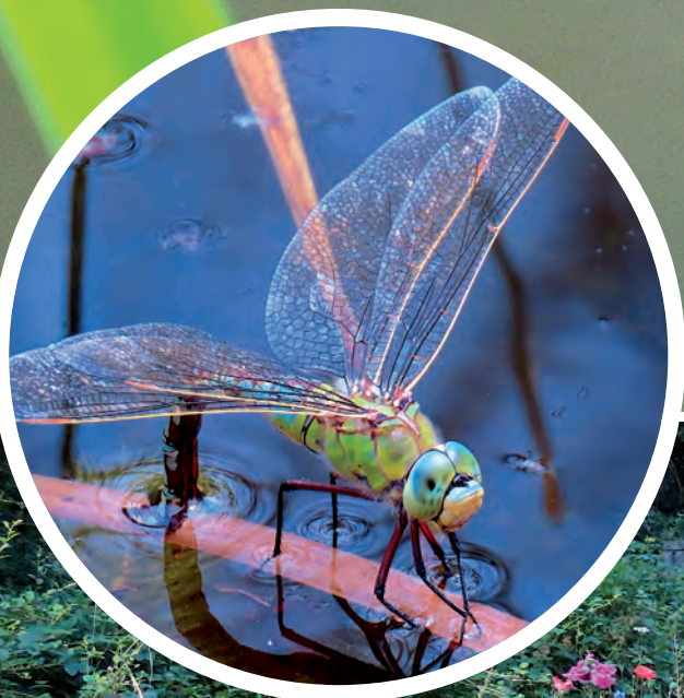
Große Königslibelle bei der Eiablage

mischung entschieden. Diese Mischung enthält nach Angaben des Anbieters Samen von 35 ein-, zwei- und mehrjährigen einheimischen Pflanzenarten, die besonders die Brutversorgung der Pollenspezialisten der Wildbienen (z. B. Sandbienen, Mauerbienen, Hummeln) fördern.