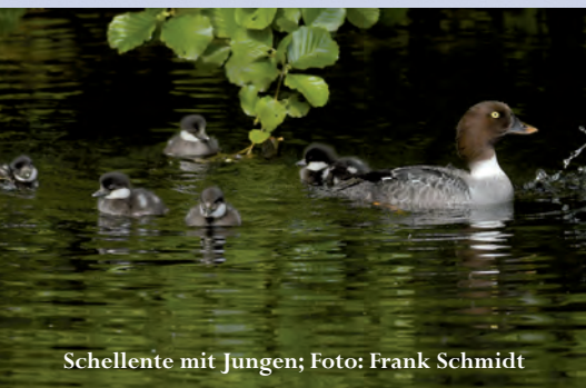
Schellente mit Jungen

■ Noch bemerkenswerter ist allerdings der zweite Brutnachweis der Schellente für Nordrhein-Westfalen (der erste wurde 2012 in Münster erbracht). So wurde erstmalig am 10.5. auf der Nette am Rohrdommelprojekt Nettetal VIE ein Weibchen beobachtet, welches insgesamt sechs Junge führte (H. Klein, H. Thier, R. Josten, F. Schmidt u. a.).