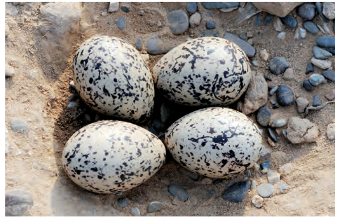
Das Vollgelege im schmucklosen Nest besteht aus vier Eiern.